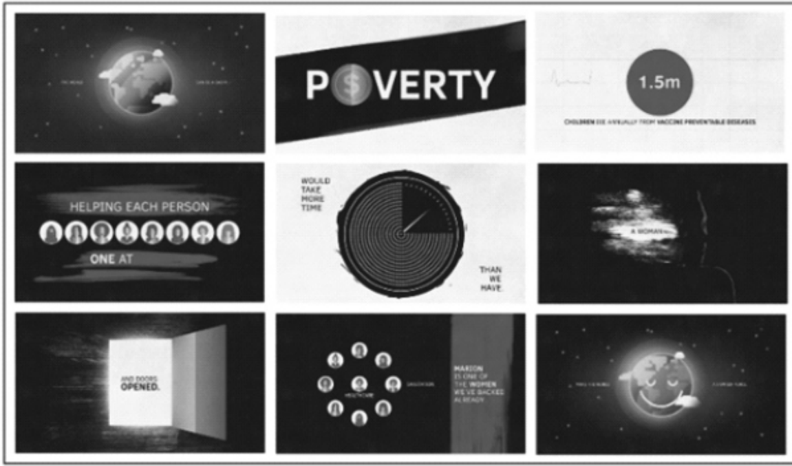
स्रोत. पॉवर अक्षफ वन वोमेन, वीडियो से लिए गए फ्रेम्स